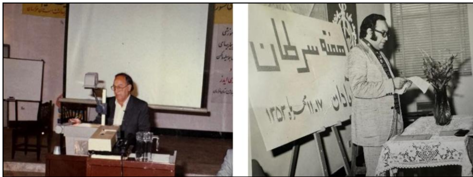
تصویر ۶: دکتر پرویز وزیریان در حال سخنرانی در برنامه‌های آموزشی؛ تصویر راست: هفته سرطان، آبادان، سال ۱۳۵۳ تصویر چپ: دوره بیماری‌های قابل پیشگیری با واکسن و ایدز، مشهد، سال ۱۳۸۳

می‌توان به تقدیرنامه‌های دریافتی ایشان از وزرای بهداشت وقت به علت مبارزه با بیماری‌های روده‌ای (سال ۱۳۵۴)، انتخاب به عنوان کارمند نمونه وزارت بهداشت (سال ۱۳۶۹)، اقدامات مؤثر در کاهش موارد بیماری وبا در کشور (سال ۱۳۷۳)، خدمات ماندگار در حوزه ریشه‌کنی فلج اطفال در ایران (سال ۱۳۸۸) اشاره کرد. جایزه فرهنگستان علوم پزشکی جمهوری اسلامی ایران بابت سال‌ها خدمات بهداشتی تأثیرگذار در کشور (در سال ۱۳۹۵) به ایشان اعطا شده است. دکتر وزیریان در سال ۱۳۷۵ نامزد دریافت جایزه جهانی آموزش برای صلح یونسکو از طرف سازمان علمی فرهنگی ملل متحد در یونسکو بود.