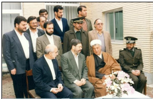
تصویر ۴. دکتر سیدعلیرضا مرندی و آیت‌الله هاشمی رفسنجانی در مراسم افتتاح آخرین دوره واکسیناسیون ایمن‌سازی فلج اطفال، سال ۱۳۷۶.

از علل موفقیت برنامه ریشه‌کنی فلج اطفال در ایران می‌توان به ایجاد همکاری بین بخشی، مشارکت افراد مختلف جامعه، ایجاد حساسیت عاطفی در جامعه، مشارکت بین بخش خصوصی و سازمان‌های دولتی، استفاده از نهادهای سازمان یافته موجود در جامعه شامل بسیج، بهورزان و رابطان بهداشتی، عدم بار مالی برای مردم، نقش خوب صدا و سیما در اطلاع‌رسانی در مورد فلج اطفال و لزوم واکسیناسیون به مردم با گویش‌های مختلف از طریق رادیو و تلویزیون‌های استانی، رهبری و برنامه‌ریزی درست وزارت بهداشت، و حمایت یونسف و سازمان جهانی بهداشت اشاره کرد.