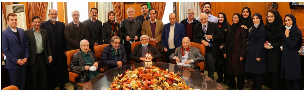
شکل ۳- برگزاری آخرین سالگرد تولد استاد بهادری در جلسه علوم پایه فرهنگستان علوم پزشکی، ۶ بهمن ۱۴۰۰ (با سپاس از سرکار خانم مهناز شهبازی)

۲۸ مقاله منتشر شده استاد دکتر بهادری و همکارانشان، به زبان انگلیسی، مربوط به دو دهه پایانی زندگی ایشان (۱۳۸۵-۱۴۰۱)، در پایاب مد (PubMed) موجود است. (۸)