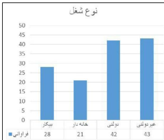
نمودار ۳. درصد فراوانی آزمودنی‌ها براساس نوع شغل

مشخصات روان‌سنجی این پرسشنامه اقدام کرده و آلفای کرونباخ کل مقیاس را ۰/۷۸ و خرده مقیاس‌های جایگاه من، واکنش‌پذیری هیجانی، هم‌آمیختگی با دیگران و برش هیجانی را به ترتیب ۰/۶۷، ۰/۴۸، ۰/۷۶ و ۰/۷۳ به دست آوردند. در مطالعه فکوری جویباری، حسن‌زاده و عباسی (۲۷) مقدار آلفای کرونباخ برای تمایز یافتگی کلی ۰/۸۳ و برای مؤلفه‌های واکنش‌پذیری عاطفی، بعد جایگاه من، گریز عاطفی و هم‌آمیختگی با دیگران به ترتیب ۰/۸۸، ۰/۸۲، ۰/۹۰ و ۰/۷۱ به دست آمده است.