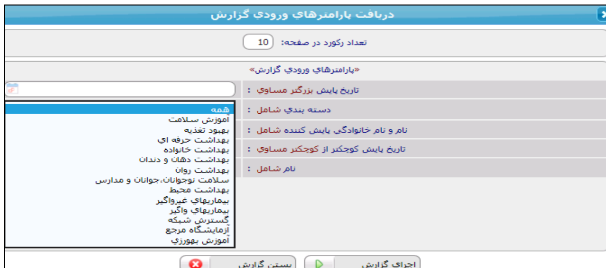
شکل ۳- داشبورد گزارش‌گیری