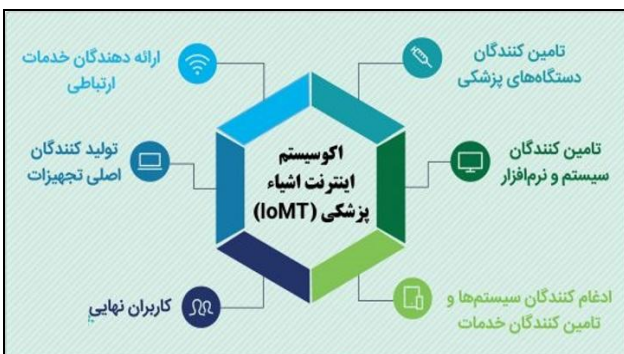
شکل ۱- ذی‌نفعان زیست‌بوم اینترنت اشیا پزشکی (۱۶)

در این زیست‌بوم، ذی‌نفعان زیادی مشارکت دارند که بخش اعظم آنها را بازیگران حوزه‌های فنی و مهندسی، فناوری اطلاعات و شبکه تشکیل می‌دهند و کاربران حوزه بهداشت و سلامت تنها یکی از این بازیگران محسوب می‌شوند (۱۰). مکنزی بازیگران اصلی اینترنت اشیا را، مشتریان (کسب و کارهایی که اینترنت اشیا را نصب و استفاده می‌کنند و مصرف‌کنندگان) و همچنین تأمین‌کنندگان سخت‌افزار، تأمین‌کنندگان نرم‌افزار و تحلیل خدمات می‌بیند و معتقد است که ارزش بیشتر اینترنت اشیا به مشتریان می‌رسد (۱۷).