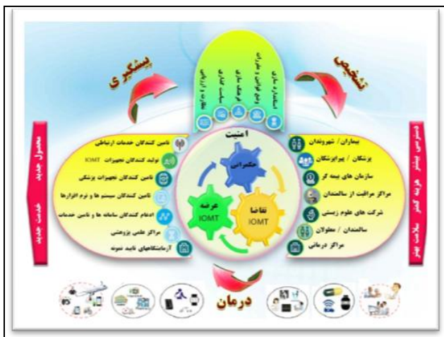
شکل ۲- مدل مفهومی زیست بوم توسعه امن اینترنت اشیا در حوزه سلامت کشور

بررسی محیطی عبارت است از پایش و پویس اطلاعات مربوط به محیط‌های داخلی و خارجی سازمان. محیط داخلی در این تحقیق، شامل تمامی بخش‌های حوزه صنعت و سلامت در محدوده داخلی کشور می باشد. یکی از بهترین منابع موجود برای شناخت عوامل محیطی اثرگذار بر توسعه فناوری، بهره‌گیری از دیدگاه‌های خبرگان و مدیران با تجربه هستند. در گام اول، واکاوی داخلی وضع موجود کشور در دو حوزه اینترنت اشیا و سلامت الکترونیک از طریق مصاحبه با مسئولان، سیاست‌گذاران و ذی‌نفعان این دو حوزه توسط محققان انجام پذیرفت (۱۰ نفر). سپس به منظور جمع‌بندی و ترکیب عوامل مؤثر محیط داخلی (شامل نقاط ضعف، شایستگی‌ها و نقاط قوت) کارگروهی متشکل از خبرگان و کارشناسان این دو حوزه تشکیل و بر اساس مدل تحقیق، عناوین و مطالب استخراج شده، در پانل خبرگان مورد بررسی، اصلاح و تدوین قرار گرفت. خروجی این پانل خبرگی منتج به استخراج نقاط ضعف (۶ مورد) و نقاط قوت‌ها (۱۲ مورد) شد.