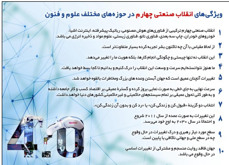
جدول ۱- ویژگی‌های انقلاب صنعتی چهارم در حوزه‌های گوناگون علوم و فنون

اطلاعات و علوم شناختی و هوش مصنوعی می‌توان بسیاری از نیازهای حوزه علوم داروسازی و پزشکی را مرتفع کرد. در جایی که این فن‌آوری‌ها با ابزارها و روش‌هایی مانند ژن‌تراپی، سلول‌های بنیادی و سلول‌های درمانی، مهندسی بافت، چاپگر سه بعدی، هوش مصنوعی، بیوانفورماتیک، پزشکی فردی، داروهای با فن‌آوری بالا مانند فرآورده‌های نوترکیب، مونوکلونال آنتی‌بادی، mRNA، microRNA، آپتامر، پپتیدهای نوین، رادیوداروها و واکسن‌های اسید نوکلئیکی و پروتئینی یا واکسن‌های خوراکی، رفع ناباروری و کلونینگ، فرآورده‌های نانو، فرآورده‌های بیومتریال‌های هوشمند، مواد و روش‌های نوین دندانپزشکی و فن‌آوری‌های نوین تشخیصی و آزمایشگاهی بالینی و فن‌آوری بیورزونانس، تصویربرداری، تجهیزات پزشکی و سیستم‌های مبتنی بر میکروفلوئیدیک و حسگرهای زیستی و همچنین محصولات فناورانه غذایی، دریایی و آرایشی و بهداشتی و بطور کلی در یک جبهه وسیع با بهره‌گیری از فن‌آوری اطلاعات می‌توانیم انقلاب بزرگی را در حوزه پزشکی و داروسازی به همراه داشته باشیم که تمام این فن‌آوری‌ها را امروزه به نام فن‌آوری‌های نوین یا ابررونده‌های بنیان برافکن در حوزه‌های علوم و فن‌آوری می‌شناسند؛ چنانچه در سال ۲۰۵۰ می‌توان شاهد شکوفایی غیر قابل تصور و حداکثری این علوم و فن‌آوری‌های نوین و همگرا و تغییرات غیر قابل باور در حوزه پزشکی و داروسازی باشیم به طوری که علوم پزشکی و داروسازی فعلی در آینده ۲۰۵۰ از جهاتی علوم سنتی شناخته خواهد شد (۴).