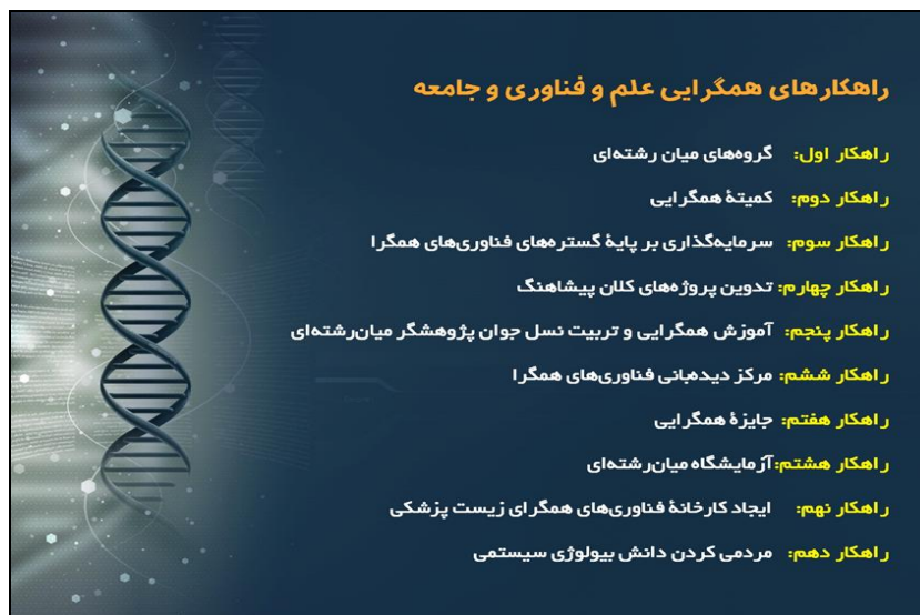
جدول ۲- راهکارهایی برای رهیافت همگرای علم و فن آوری

با فن آوری‌های نوپدید انقلابی عظیم را در نوآوری باز و اقتصاد دانش بنیان خلق کنند (۲۴).