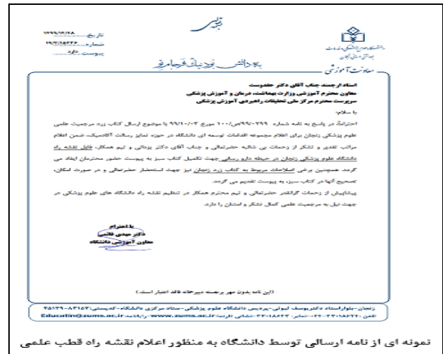
شکل ۳- نمونه‌ای از نامه دانشگاه‌ها به منظور اعلام نقشه راه

تدوین نقشه راه راهبردی (Strategic roadmap): تبدیل خط زمانی به نقشه راه مستلزم آن است که سلسله اقدامات اساسی در طول خط زمانی را بچینیم و بتوانیم روابط بین این اقدامات یا تقدم و تاخر این اقدامات را به نمایش بگذاریم. به گونه‌ای که با نگاه به این نقشه دریابیم که اقدامات اساسی در هر مرحله