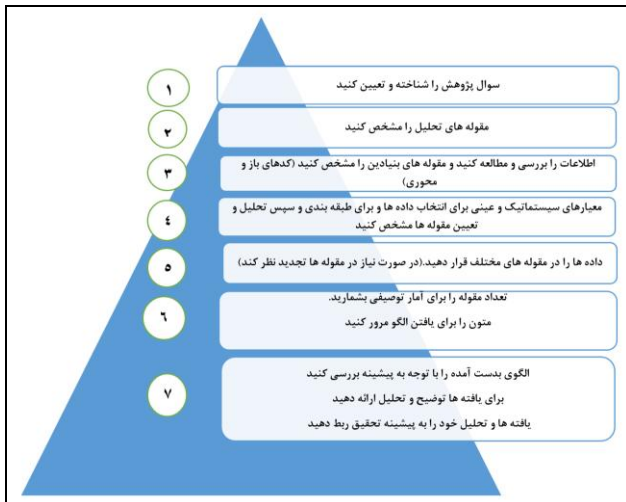
شکل ۱- مراحل تحلیل محتوا مطابق با نظر لون و برگ (۲۰۱۷)

مرحله ۱- با بررسی پیشینه تحقیق و با توجه به نیاز اعلام شده توسط وزرات بهداشت در فراخوان طرح های ملی (نصر) در سال ۱۳۹۸ سؤال تحقیق مشخص شد.