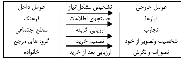
شکل ۱- مدل تصمیم‌گیری مصرف‌کننده (۲۵)

مطالعات متعددی در سال‌های اخیر در زمینه‌ی عوامل مؤثر بر انتخاب مقصد در گردشگری پزشکی انجام شده است (۳۰). بررسی گردشگری پزشکی با توجه به انگیزه‌های مختلف آن نیاز به مطالعه دقیق دارد؛ زیرا نتایجی که از این مطالعات به دست می‌آید در برنامه‌ریزی در حوزه گردشگری بسیار مؤثر است. از جمله تحقیق‌های انجام شده می‌توان به پژوهش نیک‌رفتار و همکارانش (۳۱) تحت عنوان شناسایی عوامل مؤثر در جذب گردشگران پزشکی در ایران اشاره کرد. آن‌ها در تحقیق خود چهار بعد محرک تقاضا، جستجوی اطلاعات، عوامل تسهیل‌کننده کلان و عوامل فردی و شاخص‌های زیرمجموعه هر بعد را مورد بررسی قرار دادند. با توجه به پژوهش آن‌ها در بعد عوامل فردی، توجه به شاخص‌های فرهنگی کشور مقصد گردشگران درمانی خارجی، حائز اهمیت بود. نتایج بررسی آن‌ها حاکی از آن بود که شرایط اقتصادی، سیاسی، حقوقی، فرهنگی، فن‌آوری کشور مقصد نقش مهمی را در فرایند تصمیم‌گیری گردشگران برای هر گونه فعالیت گردشگری بازی می‌کند؛ اما این شرایط نقشی مهم‌تر و بااهمیت‌تر در زمینه گردشگری پزشکی دارد.