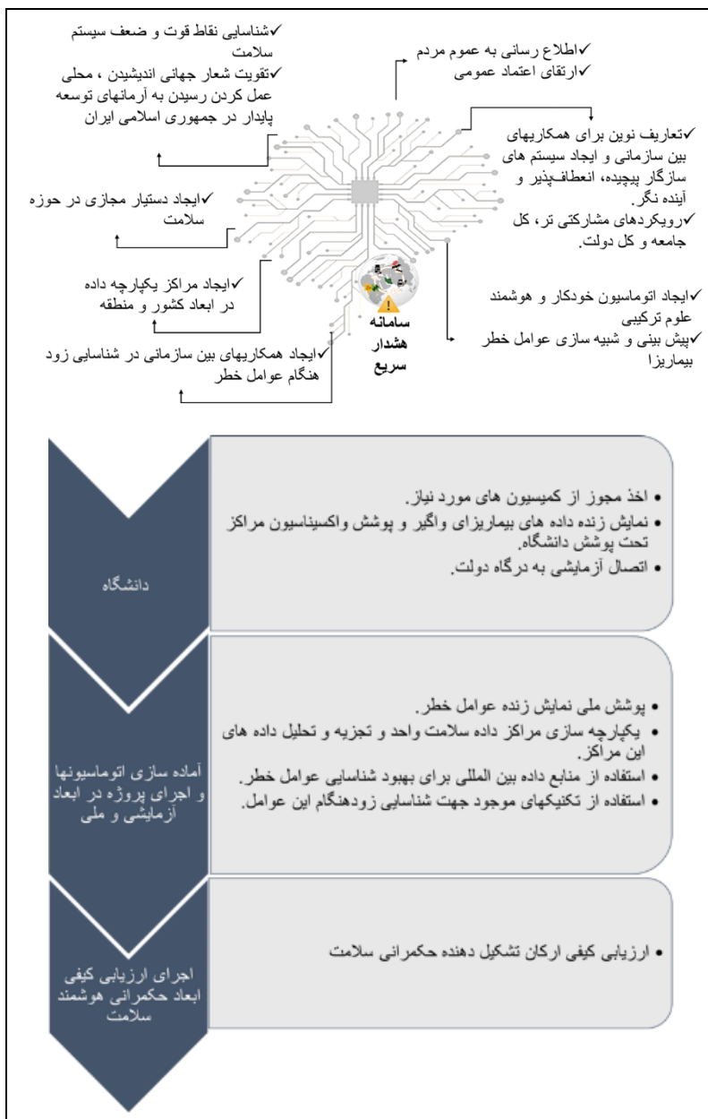
شکل ۲. مرور کلی، تصویر سمت چپ مراحل تشکیل دهنده طرح، تصویر سمت راست برخی از ابعاد طرح را نشان می دهد

پیچیده، از مسیر بررسی ریشه‌ای آنها باشد که می‌تواند به عنوان بازویی قابل اعتماد، نقش پررنگی را در تصمیم‌سازی‌های سیاست‌گذاران در سیاست‌های کلان و خرد ایفا کند.