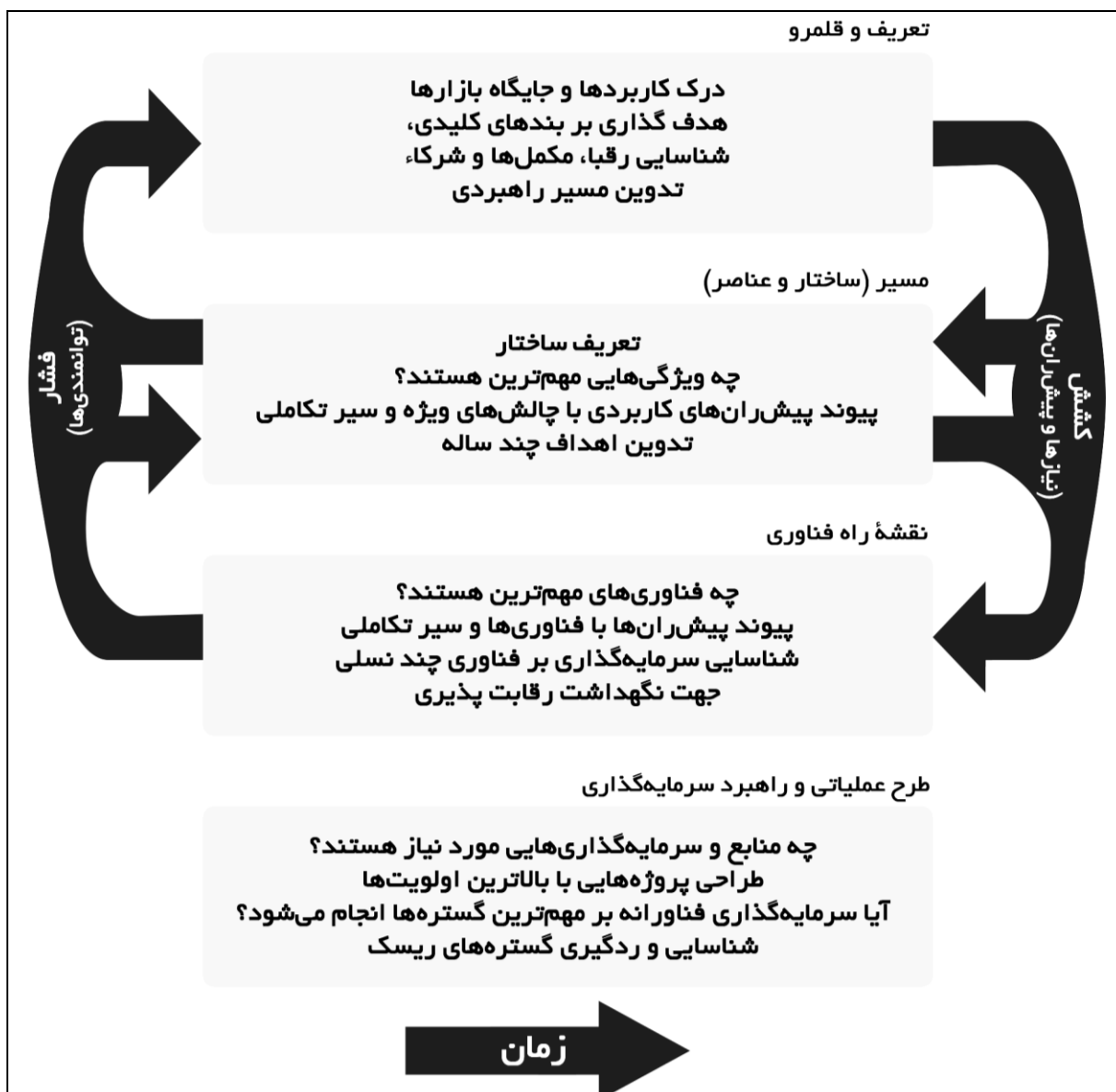
شکل ۱ - چهارچوب نقشه راه چهار گامی آلبرایت

ایران، آنالیز ابر روندهای سلامت و آینده پزشکی، نقشه علمی بنیاد علمی سلامت آمریکا (NIH) و پروژه‌های میان رشته‌ای مؤسسه‌های وابسته آن و نیز نقشه راه تدوین یافته وزارت بهداشت، درمان و آموزش پزشکی برای حرکت به سوی دانشگاه نسل سوم است.