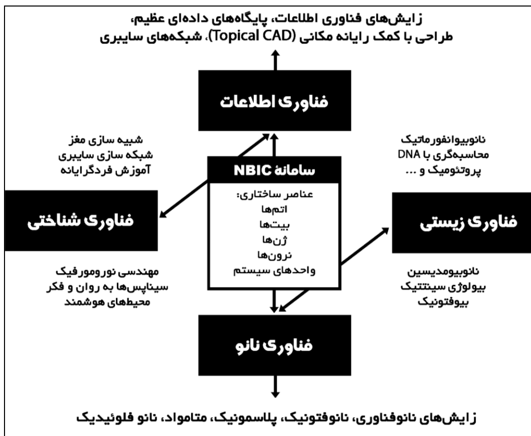
شکل ۲- ابزارهای بنیادی/پلاتفورم NBIC و پژوهش‌های زایشی از هر کدامیک از این فناوری‌ها (زیستی - اطلاعاتی، نانویی و شناختی)

مثال‌های برجسته‌ای از همگرایی را می‌توان یافت کرد (۹). در هر صورت، هم اکنون مسلم شده است که همگرایی، یک جهان نوین از اکتشاف، نوآوری و فرصت‌های به‌کارگیری را از طریق تئوری‌ها، اصول و شیوه‌های ویژه برای پیاده‌سازی در گستره‌های پژوهش، آموزش، تولید و دیگر فعالیت‌های جامعه، ارائه می‌دهد. با به‌کارگیری یک رهیافت جامع با اهداف مشترک، همگرایی مستولی شدن بر محدوده‌های موجود انسان برای دستیابی به شرایط برنامه بهبود یافته برای کار، یادگیری، سالخوردگی، سلامت شناختی و فیزیکی را جستجو می‌کند (۱۵). از این رو، "همگرایی دانش و فناوری برای سودمندی جامعه" (CKTS) به‌عنوان قلب فرصت برای پیشرفت در قرن بیست و یکم معرفی شده است (۱۶).