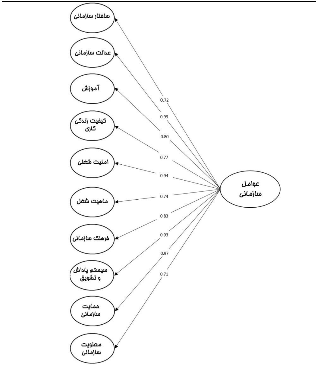
شکل ۲- مدل نهایی تحقیق

بخشی از زندگی فرد می‌باشد. در این میان احتمال کمک و یاری به همکاران، انجام کار در ساعت‌های غیر اداری، کار کردن با تعهد و وجدان بالا و ... به عنوان نمونه‌هایی از رفتارهای شهروند سازمانی نیز افزایش می‌یابد.